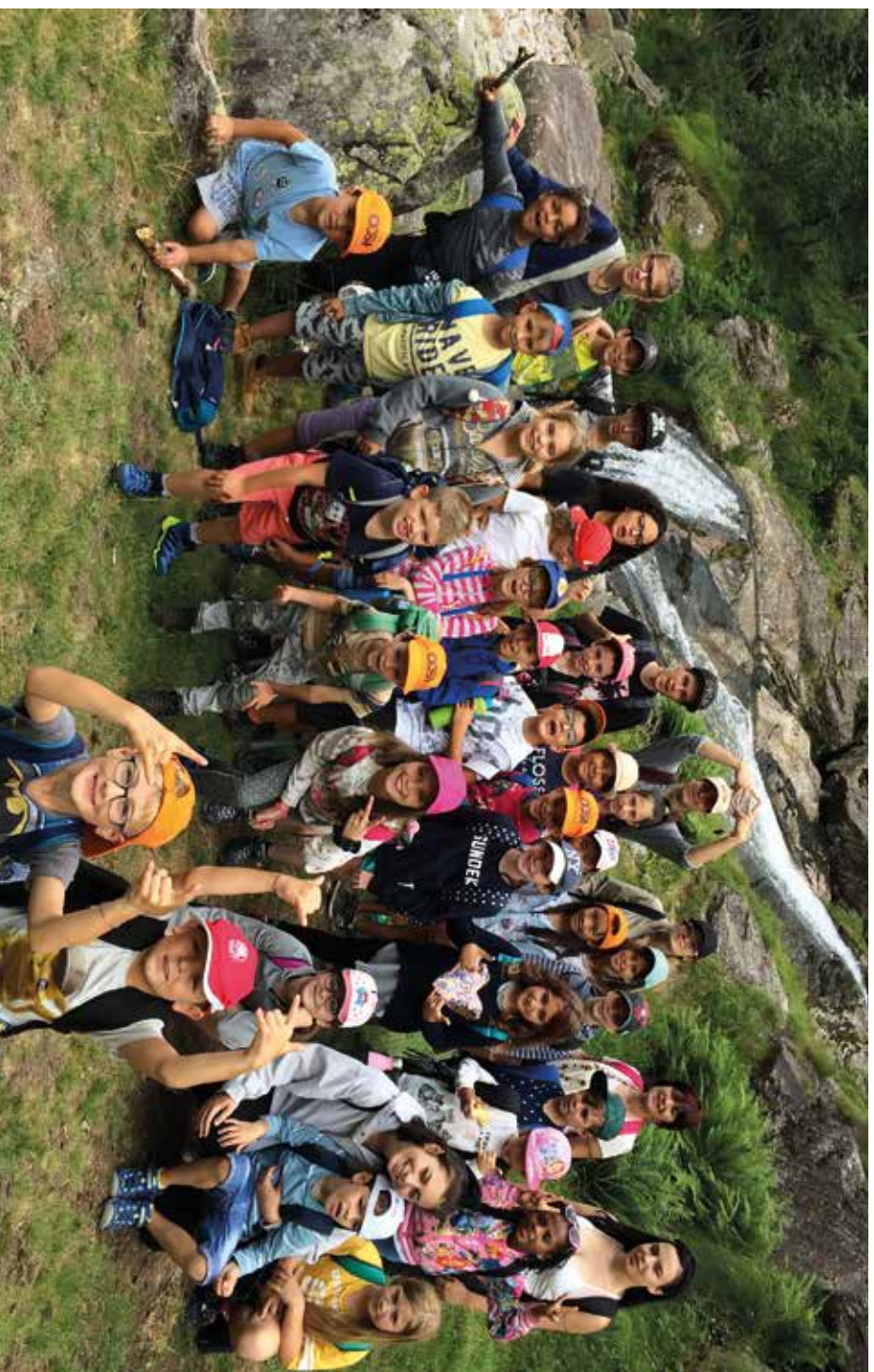
Tutti i grandi sono stati bambini una volta. (Ma pochi di essi se ne ricordano).