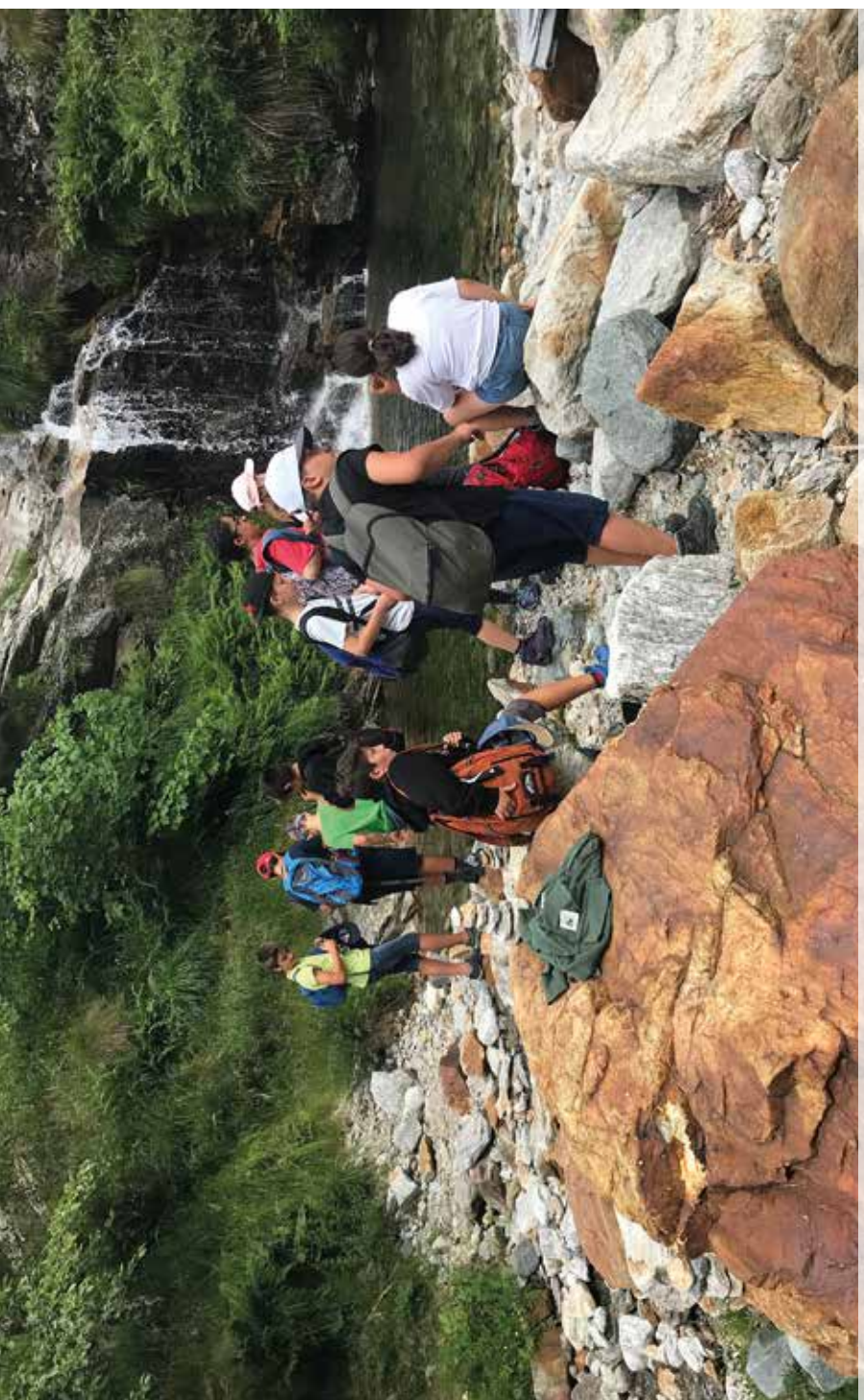
Non sei mai stato bambino se non sei saltato a piedi pari dentro una pozzanghera, svegliando le fate che dormivano e facendole saltare in mille gocce di luce fino al cielo.