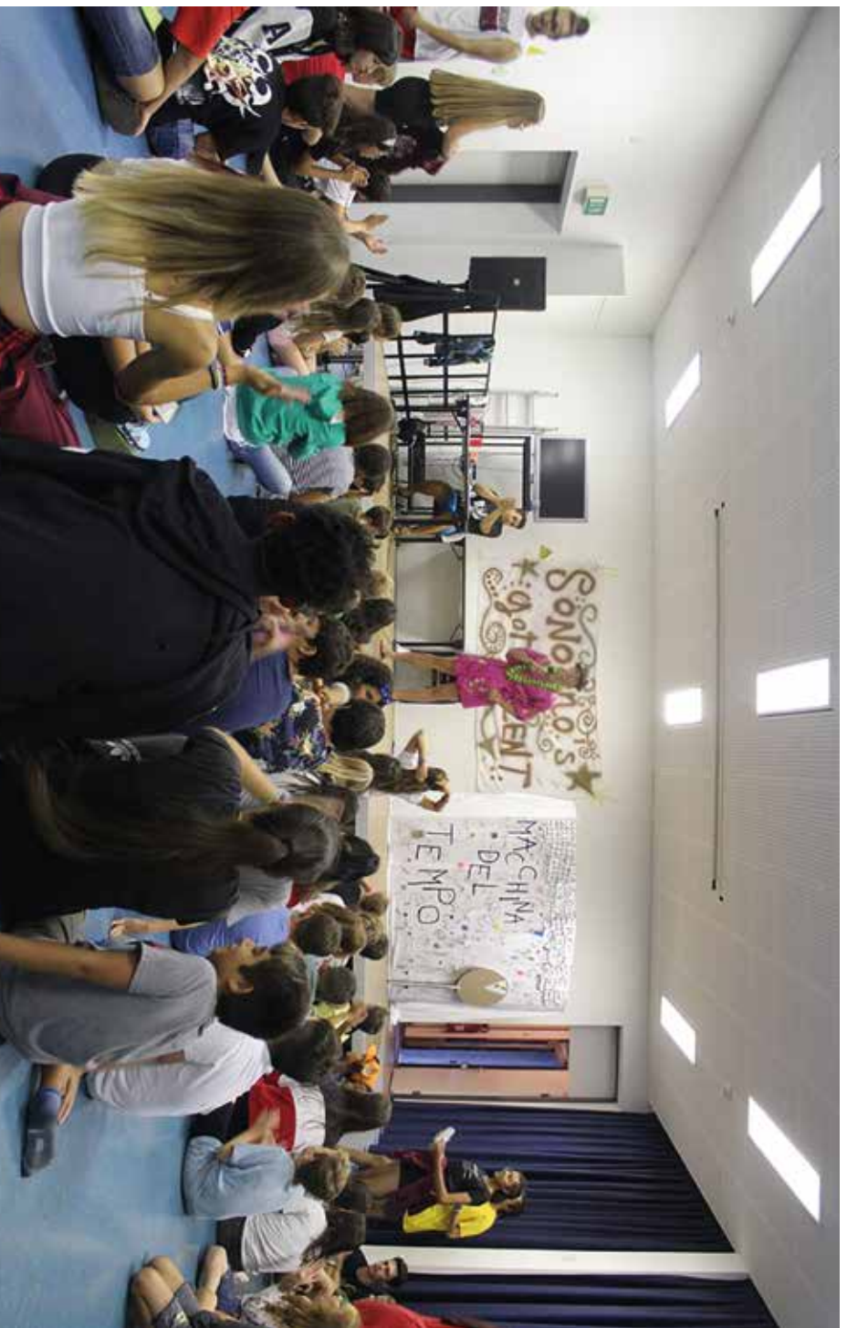
Ci sono solo due lasciti inesauribili che dobbiamo sperare di trasmettere ai nostri figli: delle radici e delle ali.

Dobbiamo imparare dai bambini. Amano senza dubitare. Abbracciano senza avvisare. Ridono senza pensarci. Scrivono cose colorate sulle pareti. Credono ad almeno 10 sogni impossibili.